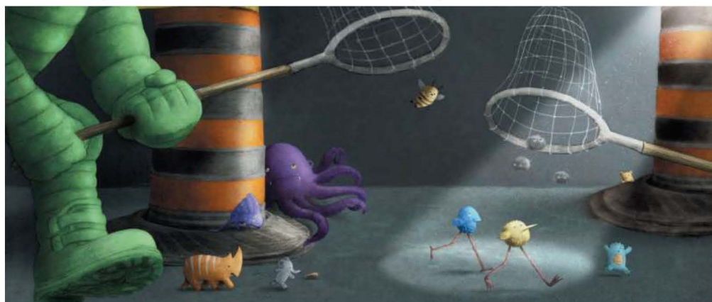
Sono realizzati a grafite e colorati digitalmente i disegni del collettivo The Fan Brothers che firma l'album «Barnabus»