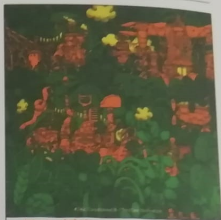
L'incredibile corsa allo sciroppo