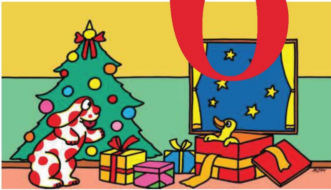
La papera Olivia dentro un pacco regalo in «Pimpa e la sorpresa di Natale» di Altan