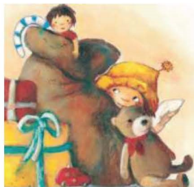
«L'angioletto e Babbo Lepre», firmato a più mani