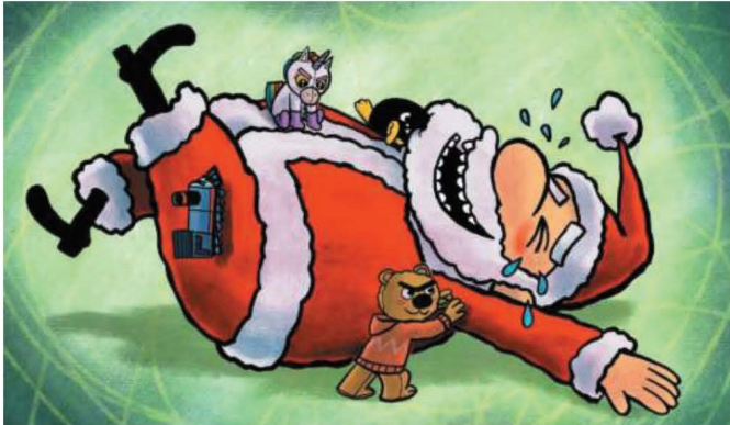
È firmato da Gud il divertente «Chi ha fermato il Natale?»